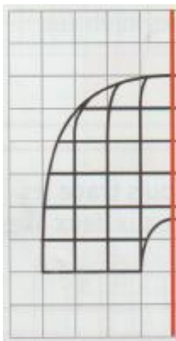
dessin à compléter